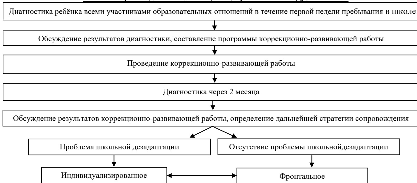
Схема сопровождения обучающихся, прибывших из других школ

Сопровождение обучающихся, успешно адаптировавшихся к новым условиям, остаётся фронтальным. Для обучающихся, у которых имеется проблема школьной дезадаптации, психолого-педагогическое сопровождение организуется как индивидуализированное.