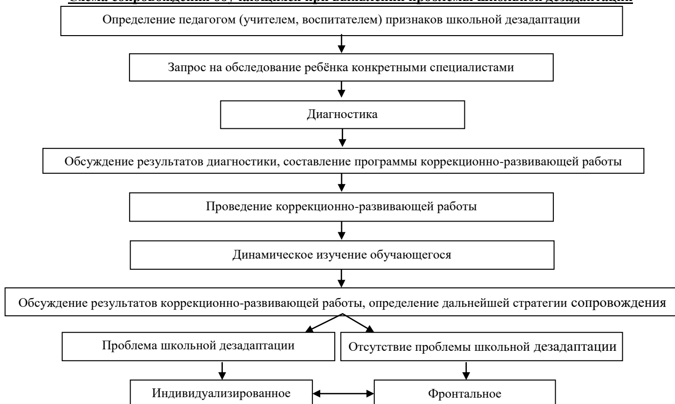
Схема сопровождения обучающихся при выявлении проблемы школьной дезадаптации

Сопровождение обучающихся, у которых выявлены проблемы школьной дезадаптации, представлено в следующей схеме.