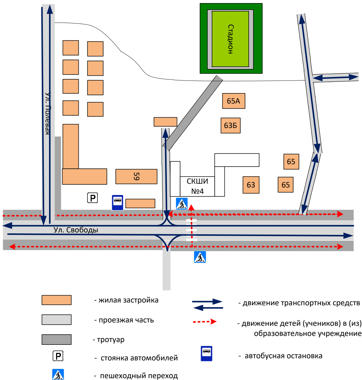
Схема организации дорожного движения в непосредственной близости от образовательного учреждения с размещением соответствующих технических средств, маршруты движения обучающихся (воспитанников) и расположение парковочных мест